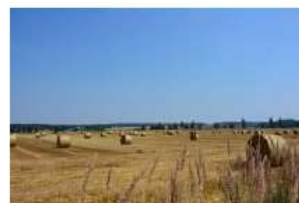
miejsce III – Danuta Wapińska Wiejski pejzaż