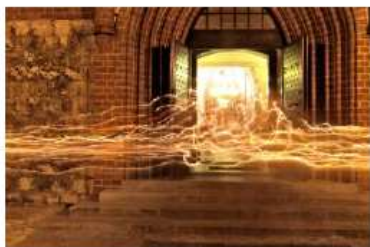
miejsce I – Dariusz Zwardoń Wieczorna procesja